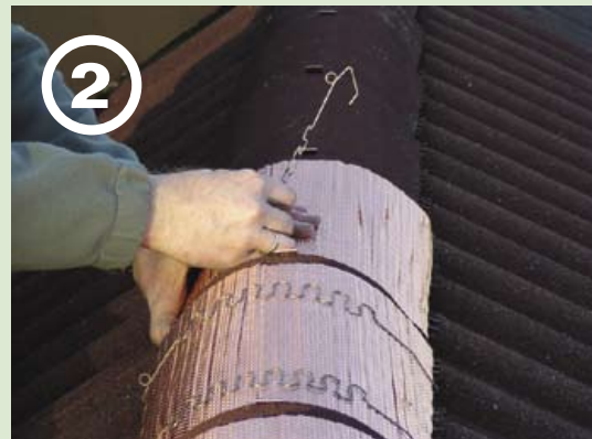
... ausrichten, festklammern ...