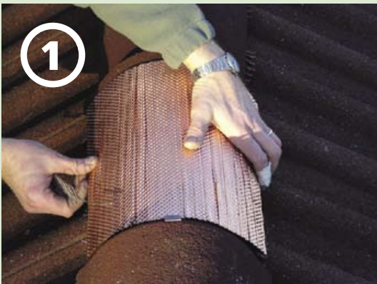
First-Element auflegen ...