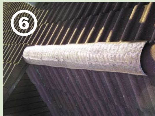
6 An der Überlappung evtl. Zusatzfeder setzen ...

Nie mehr Algen und Moose auf dem Dach · Für neue und alte Dächer geeignet · Beugt Frostschäden vor!