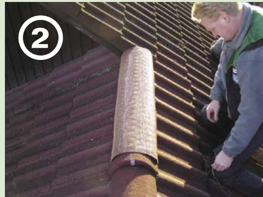
2 1m Element auflegen