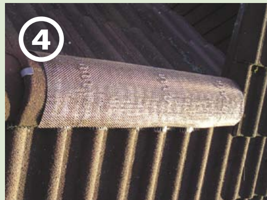
4 3 Federn pro 1 Element