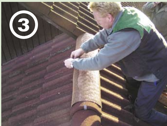
3 Erstes Element festspannen