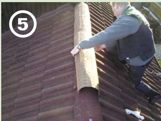
5 Elemente ca. 1 cm überlappen