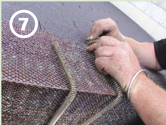
... gegenüber einhängen ...