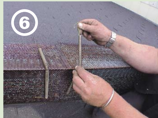
... spannen ...