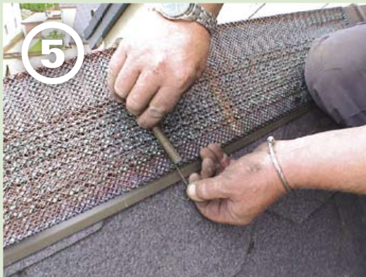
... Haltefeder einhacken ...